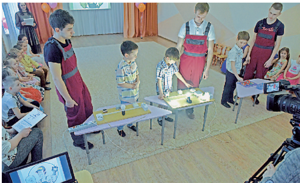
Вдохновленные Златмашем, юные электрики удивляют гостей

машиностроительного завода, основное внимание было приковано к профессиям нашего градообразующего предприятия.