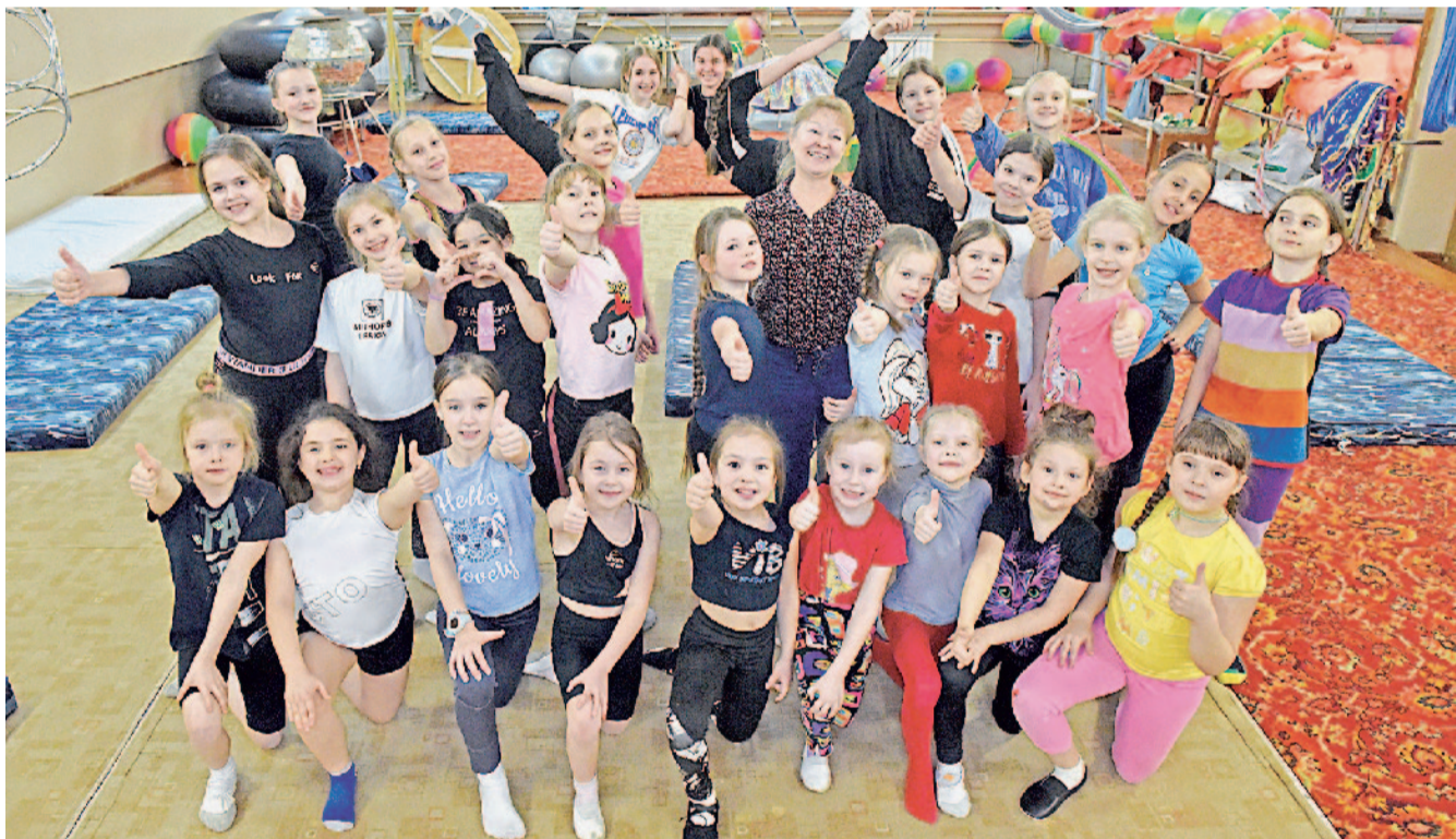
Цирковая студия – большая и дружная семья