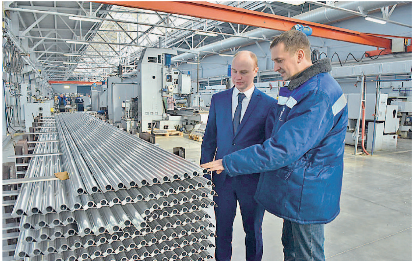
На производстве алюминиевого профиля.