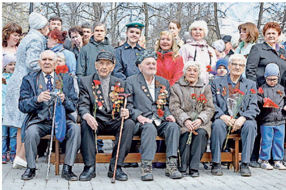
В строю – ветераны.

Из года в год дорогими гостями заводского митинга становятся ветераны войны – заводчане, которым на себе пришлось испытать все ужасы службы на передовой. Со временем воспоминания стирают-