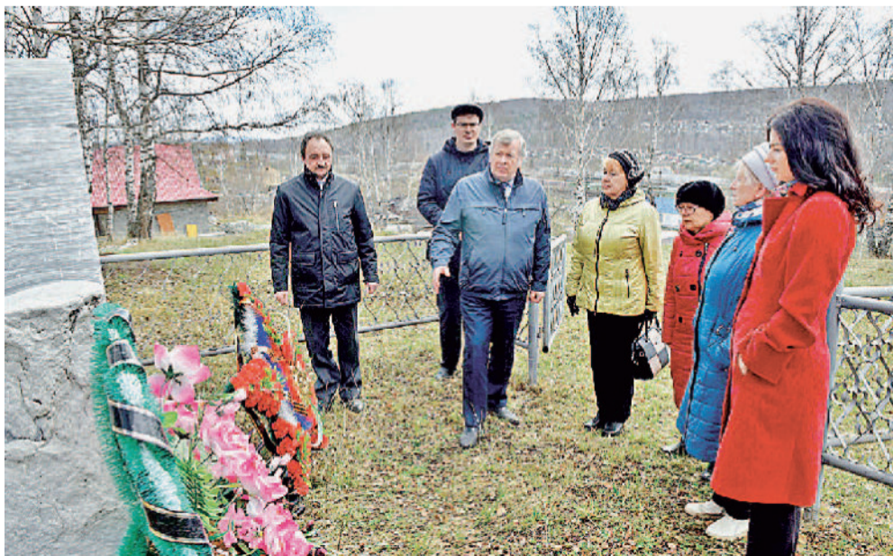
Страница подготовлена пресс-службой АО «Златмаш»